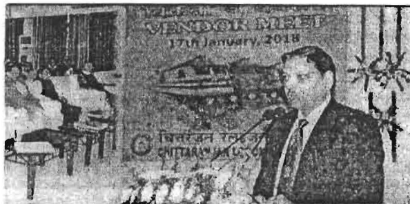
CLW addressing vendors' meet on Wednesday